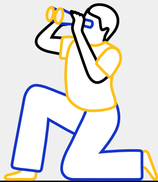
ملاحظة الإشارات الدالة